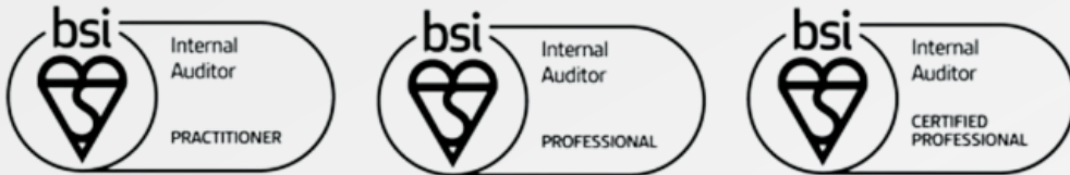
< BSI 트러스트 마크 > A mark of trust for your expertise

BSI 트러스트 마크는 귀하의 전문성에 대한 확신을 갖게 됩니다. 이력서 뿐만 아니라 명함, 이메일 서명 또는 LinkedIn 프로필에 BSI 자격 마크를 사용하여 귀하의 전문 자격을 성공으로 홍보하세요!